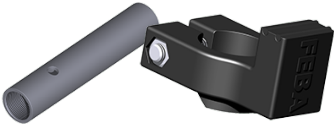
VR14 Verlengbuis, Ø14mm, met M12x1 IG